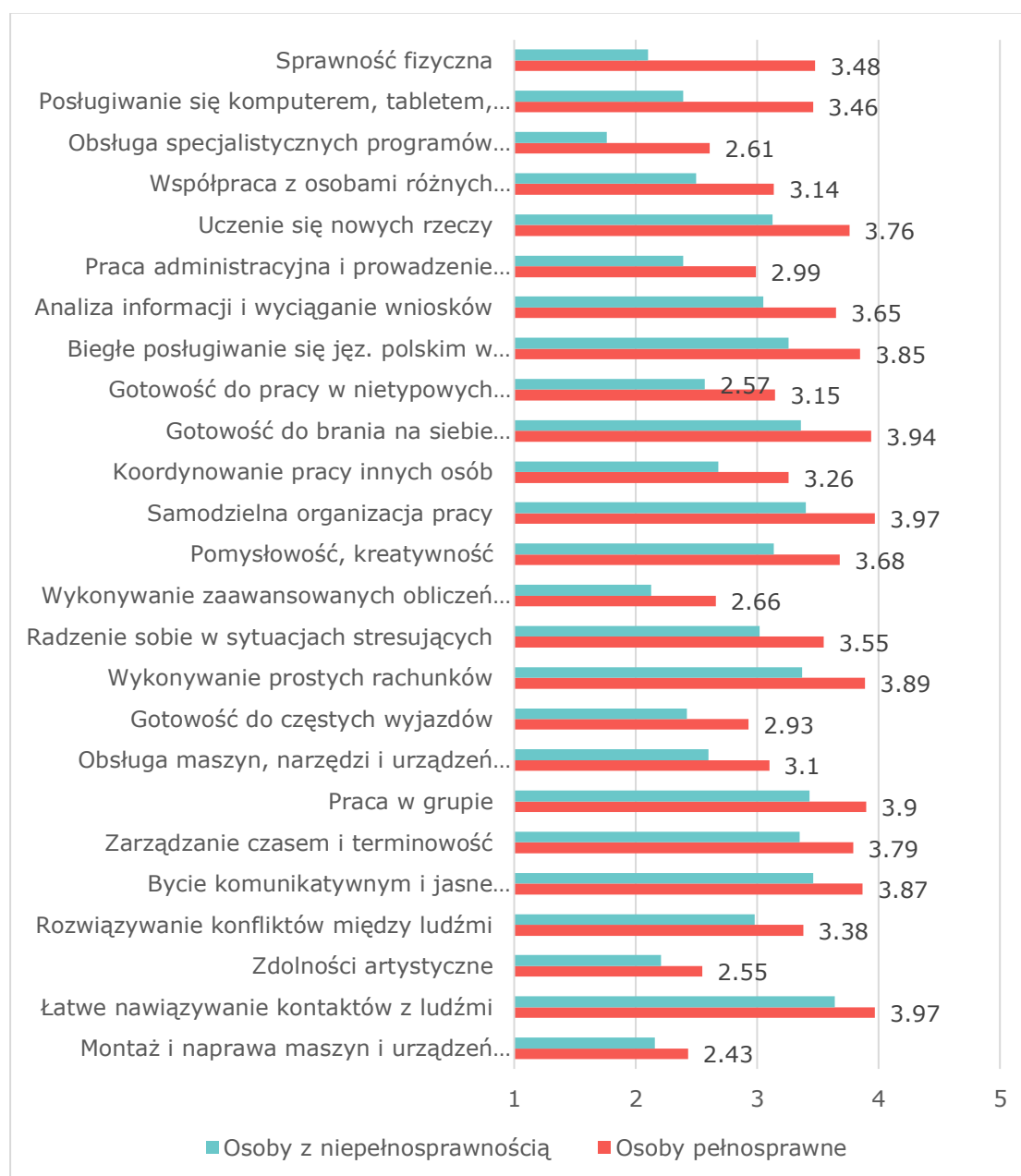
Wykres 1. Porównanie samooceny kompetencji ogólnych osób z niepełnosprawnościami i pełnosprawnych (średnie na skali od 1 – niski poziom do 5 – wysoki poziom).